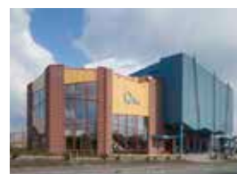
Het Sporthuis, Abcoude