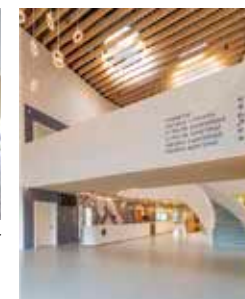
Sportcomplex De Sportwaard