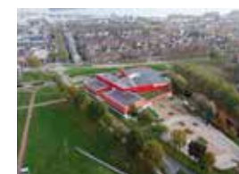
Sportcomplex Het Baken