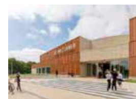
Sportcomplex de Wiltsangh