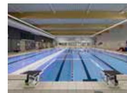
Sportcentrum De Bloesem