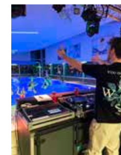
Discozwemmen met DJ Martixx