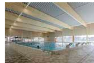
Zwembad De Stamper