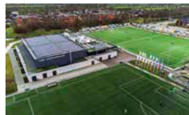
Sportcomplex Nije Westermar