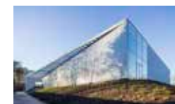
Sportcomplex Het Binnenveld