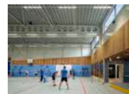
Sporthal De Drait