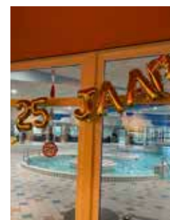
Accres exploiteert onder meer Aquacentrum Malkander, dat in 2024 eveneens 25 jaar bestaat

Een andere of betere manier vinden om met energie om te gaan, zorgt voor minder druk op het klimaat en een kostenbesparing. De laatste paar jaar is Accres dan ook op veel locaties aan het verduurzamen, waaronder bij Aquacentrum Malkander.