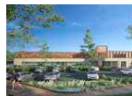
Feel Fit Center Rhenen