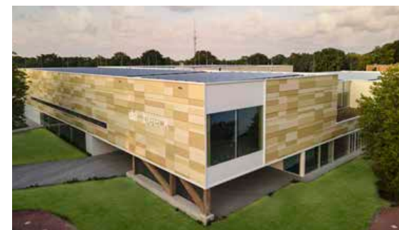
Sportcentrum De Beeck