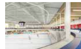
Combibad en ijsshal De Vliet