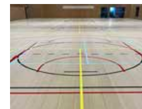
Huis voor Sport en Cultuur