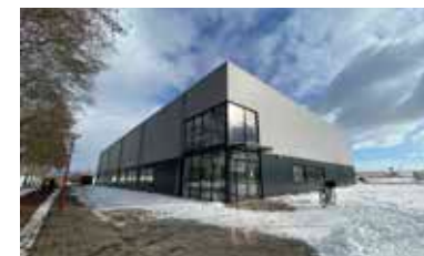
Turnhal Sportstad Heerenveen