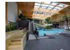
Zwembad Van Tuylpark