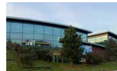
Sportcentrum De Zandzee