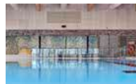
De Hoge Devel