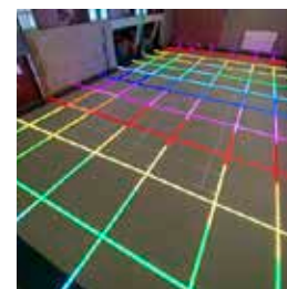
Pulastic RGB Ledcourt