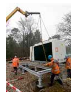
In 2018 vervangt een warmtepomp het gas in het door Accres geëxploiteerde Boschbad