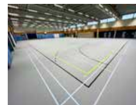
Sporthal De Drait

sportvloer verwijderd en vernalen tot korrels. In 2023 is de oude sportvloer volledig gebruikt voor de aanleg van de dempende onderlaag van de nieuwe sportvloer, NOC*NSF-klasse 2. Daarnaast zijn alle toilet- en kleedruimtes voorzien van decoratieve gietvloeren.