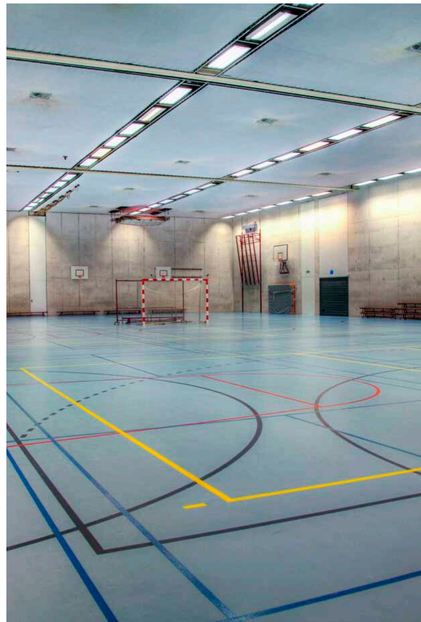
Sporthall Metzo College, Doetichem