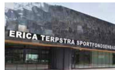
Erica Terpstra Sportfondsenbad